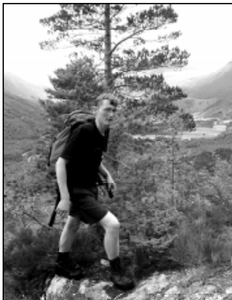
Are Ingulfsvann på vei opp mot Regndalsbreen

turen videre opp til selve breen og opp mot "Vallanykkjin" som de kaller fjellet ved breen på dialekt.